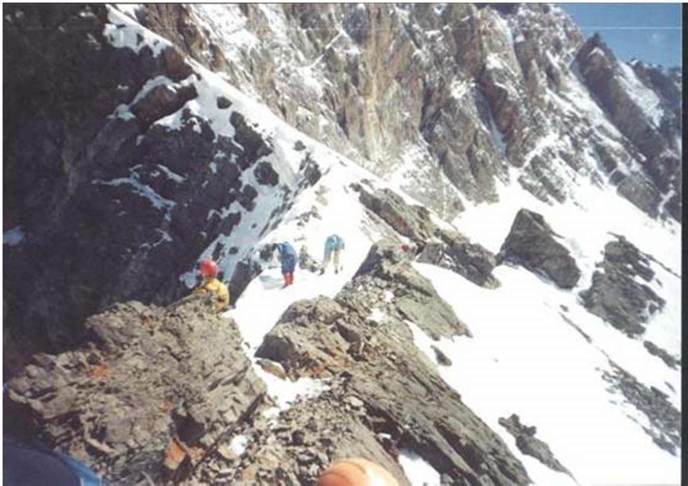
Samaara kuru sadul (Andrejev-2002)