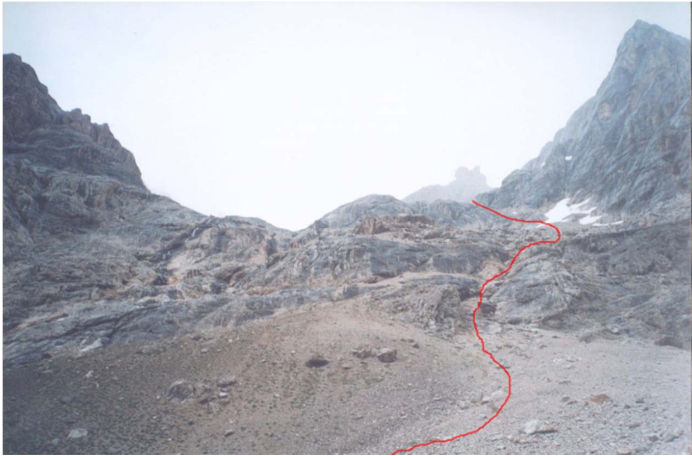
Laskumine silekaljudel (Romanenkov-2004)

Ivanov-2006: 12 день. 13 августа. р. Казнок – пер. Самарский – р. Л. Зиндон – оз В. Алло. Выход 7:30. Метод движения используем тот же – тупо лезем вправо вверх по сыпуче, прижимаясь к основному хребту, хотя, возможно, есть обход слева. В результате через 1,5 часа выходим на перемычку в скальном отрожке и видим впереди цирк перевала Самарский (см. фото). Немного теряем высоту, спускаясь к моренному озеру . Обходим озеро справа и выходим на ледник. По леднику подходим под перевальный взлет. Перевальный взлет представляет среднюю живую осыпь со скальными разрушающимися выступами. От озера до седловины поднимаемся за 50 мин. Седловина скальная, довольно широкая. Спуск выглядит внушительно – почти вертикальная скальная стена. Решаем перекусить, одновременно психика привыкает к наличию рядом пропасти. В середине седловины стоит большой камень – на нем почти новая красная петля из 10 мм веревки с металлическим кольцом. Ну что же, грех не использовать.