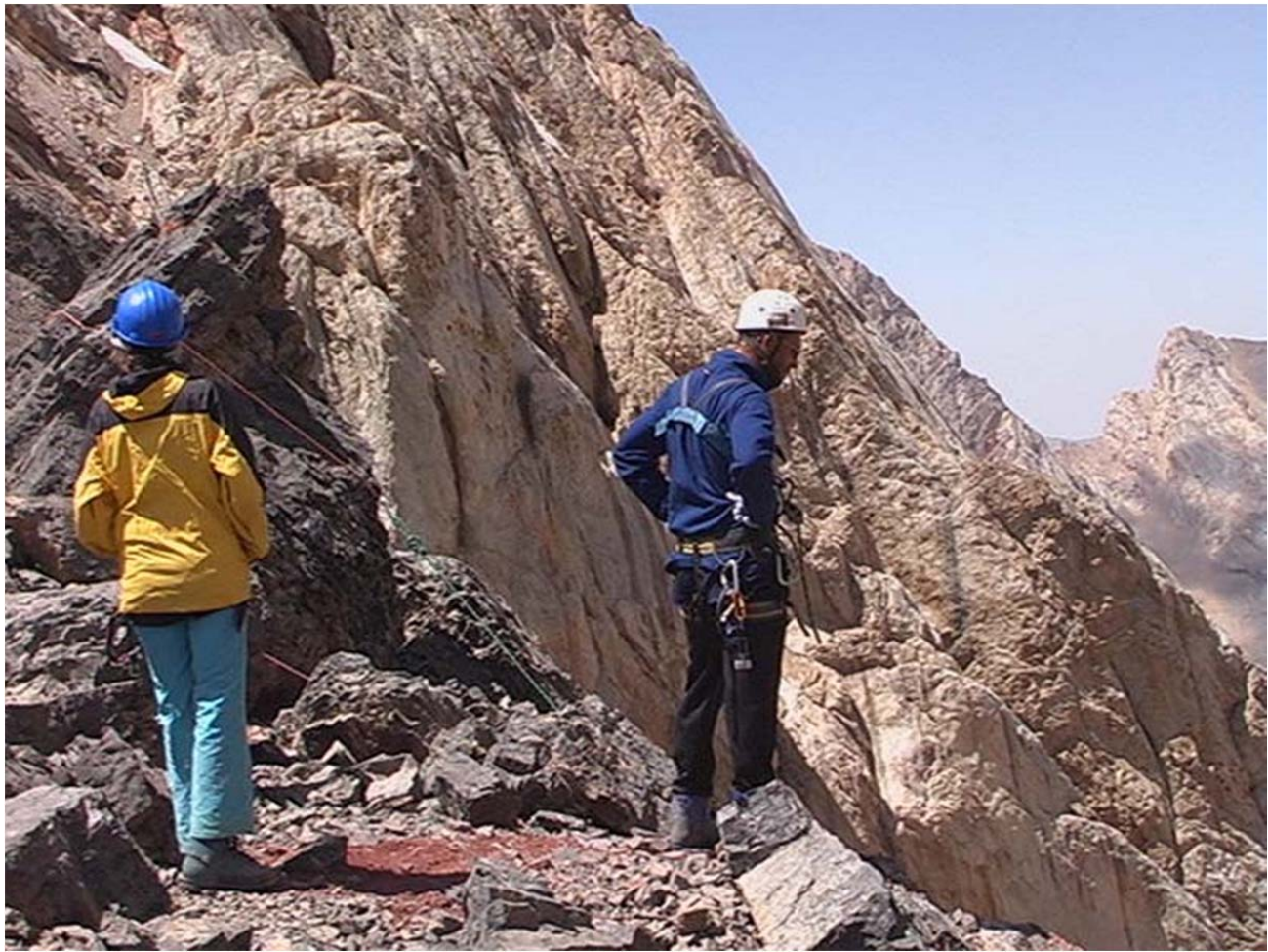
Samaara kuru sadulal