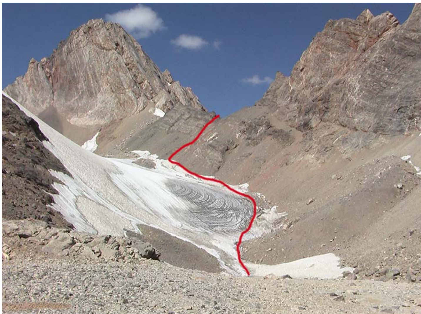
Samaara kuru Kaznoki (ida) poolt