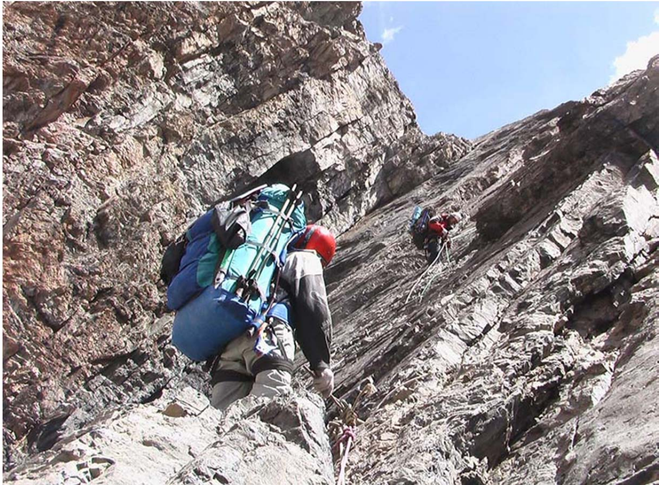
Laskumine Samaara kuru läänenõlval