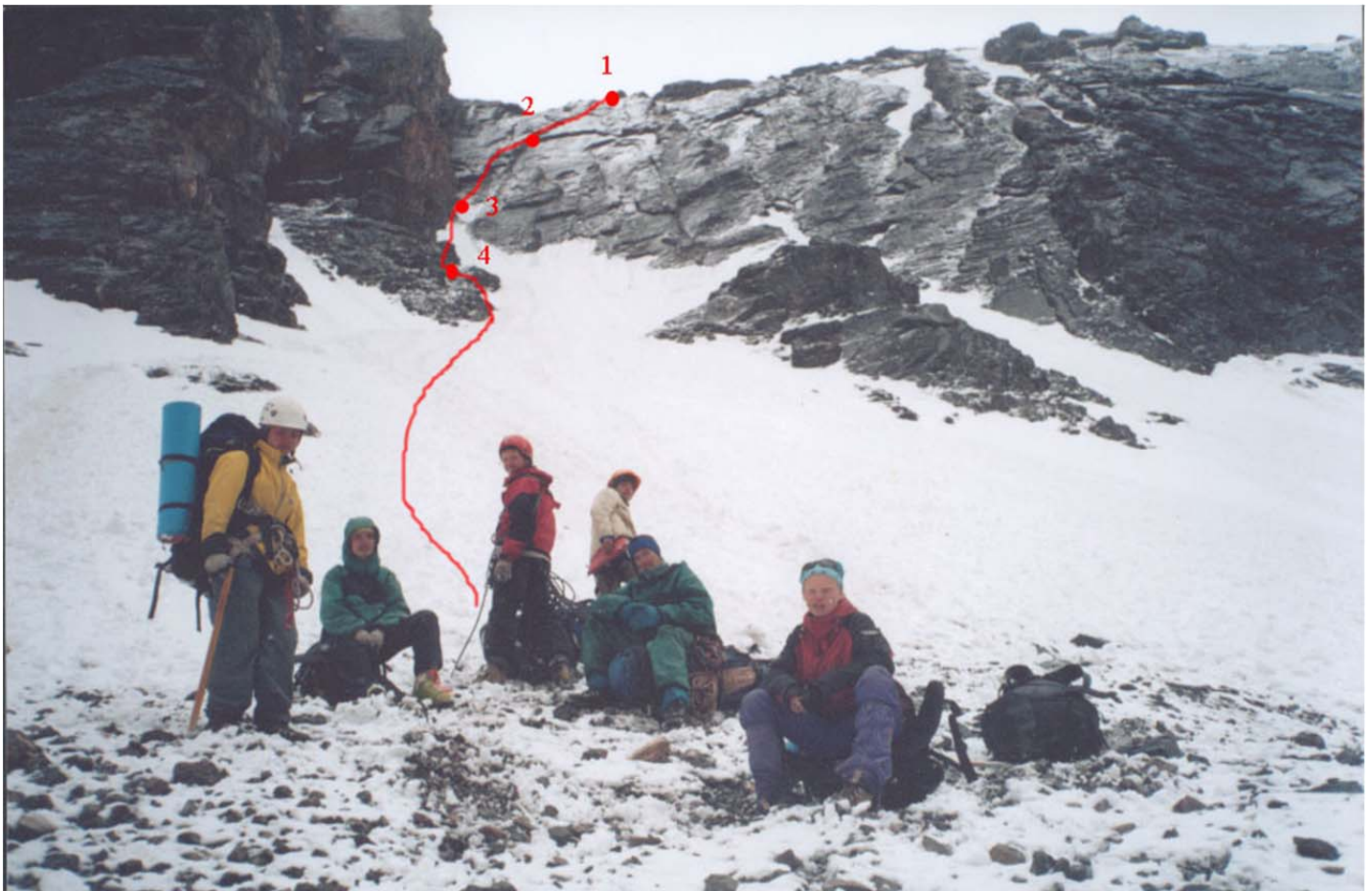
Samaara kuru lääne poolt P-Zindoni orust (Romanenkov-2004)