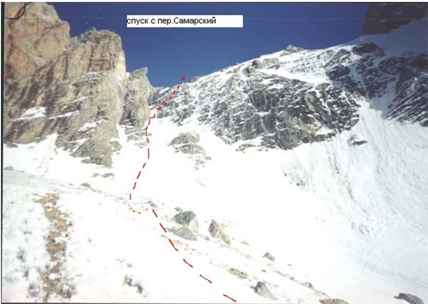
Samaara kuru läänenõlv