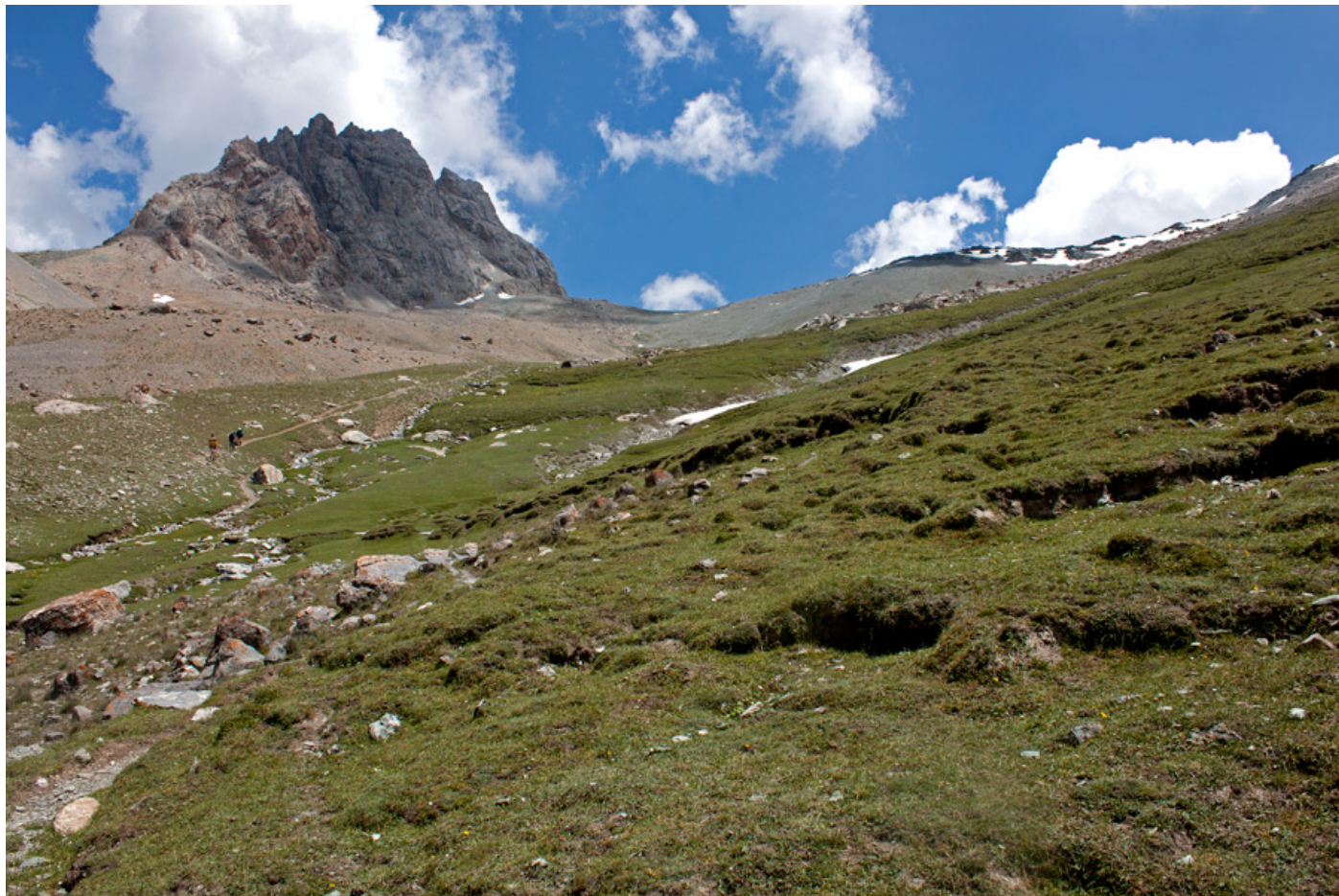
Спуск с перевала Алаудин по тропе в сторону озера Дюшаха