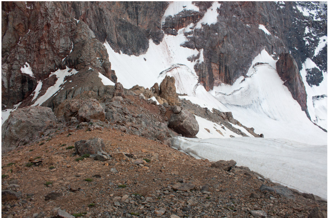
Седловина перевала Адамташ