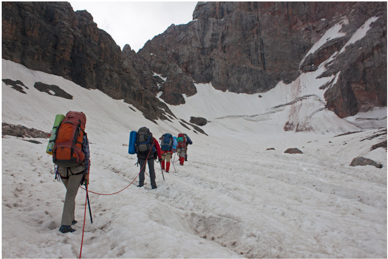
На леднике перед перевальным взлетом