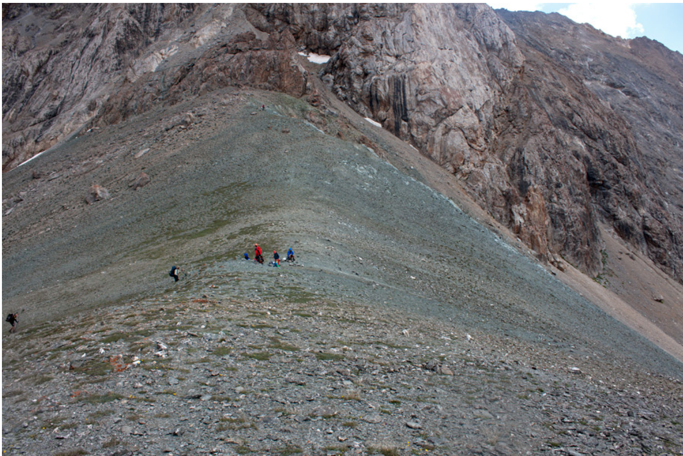
Седловина перевала. Алаудинские озера – справа, озеро Дюшаха – слева