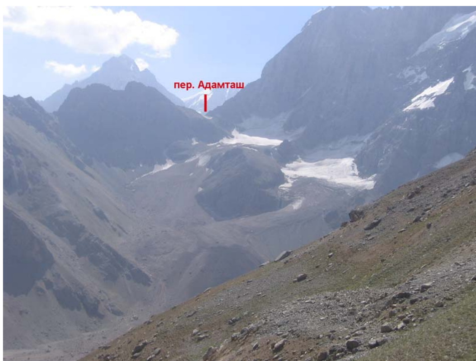
Adamtashi kuru – vaade Fluoriidi kurult