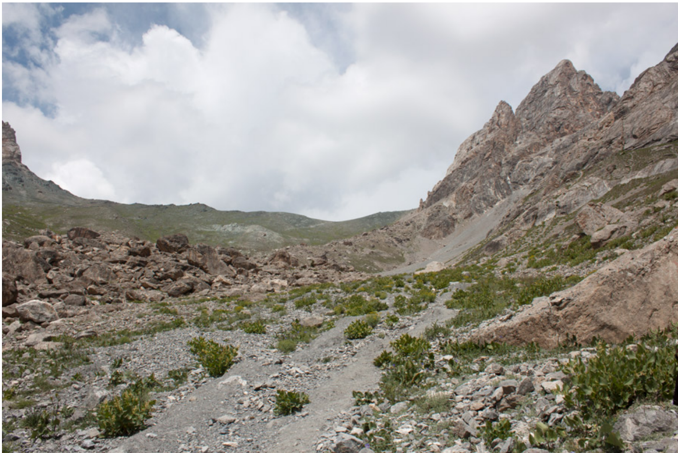
Подъем на перевал со стороны Алаудинских озер