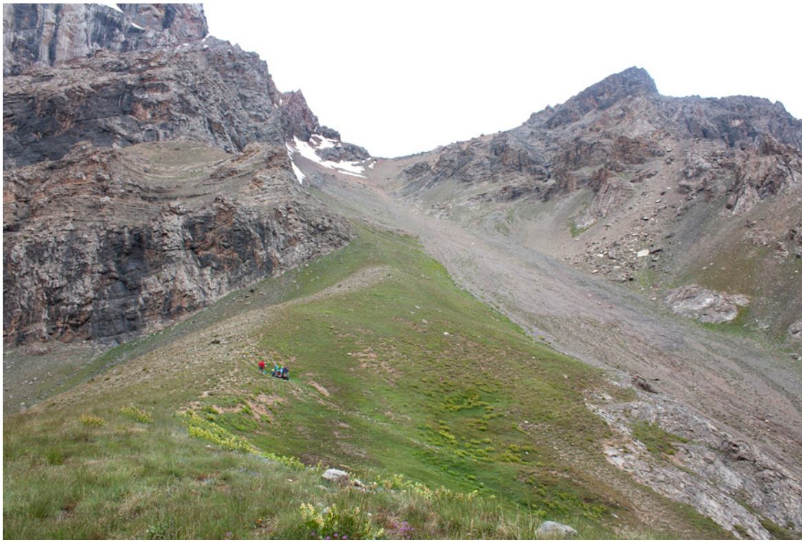
Восточный склон перевала Адамташ