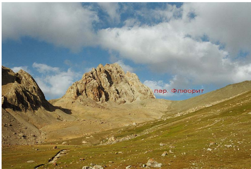
Fluoriidi kuru (ilmselt Djusahi järve juurest)

3. päev. Liikusid üle Adamtashi kuru tagasi Alaudini järvede ja alpilaagri juurde. Djusahi järvest vasakul algab hea teerada, seda mööda 15 min. Siis algab moreeninõlv, mida mööda tõusid 3 tundi. Siis jääne lõik 40 m, 35 kraadi. Panid kassid. Edasi laugem liustikuosa, mis kaetud kividega. Läksid valesti (hoidusid liiga tsirkuse paremasse nurka), pidid traverseerima ning hoopis laskusid kurule. Kokku 5,5 tundi tõusu alt Djusahi järve juurest. Laskumine kurult on mööda rusunõlva, enne silekaljusid võtsid vasakule ja jõudsid rususele sadulale ja jätkasid laskumist teisel pool mäeribi. Seejärel tõmbavad jälle vasakule ja ületavad veel ühe ribi. Laskumiseks Alaudini järvede juurde kulus 4 tundi . Järve juurest alpilaagrisse minek võtab ca 20 min. Kokku 9 km.