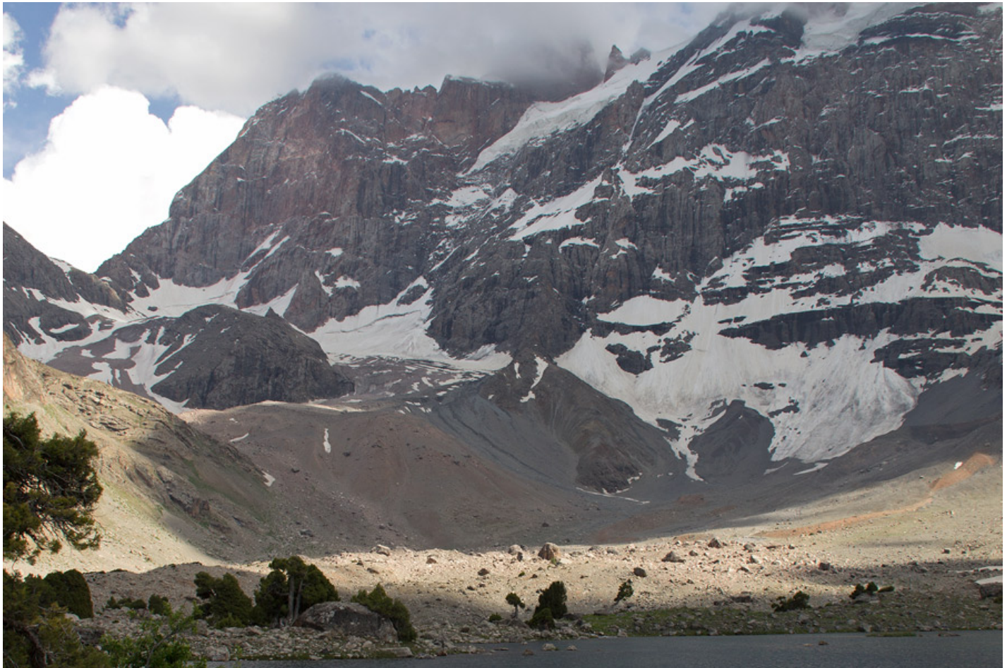
Вид на перевал Адамташ со стороны озера Дюшаха

Спуск с перевала очень долгий и утомительный, крутизна доходит до 40°. Сначала идет мелкая подвижная осыпь, местами попадаются участки снега, затем склон становится травянистым и ниже переходит в скальный сброс. С травянистого склона справа виднеется озеро Пиала с удивительно чистой и прозрачной водой. К Алаудинским озерам нужно идти влево. Воды на протяжении всего спуска нигде нет.