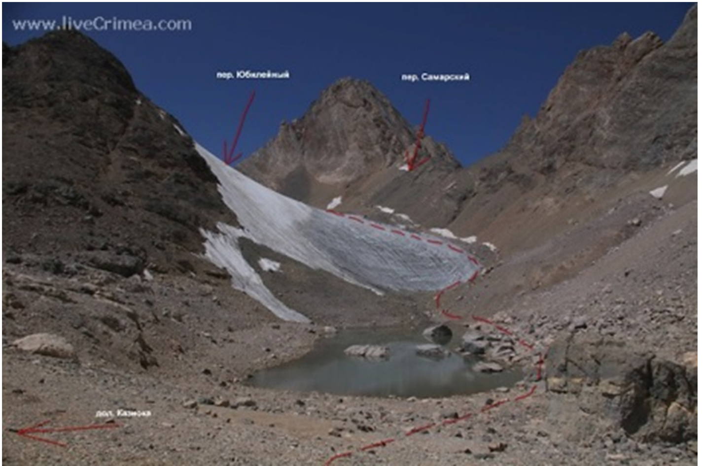
Jubileinõi ja Samaara kurud Kaznoki oru poolt