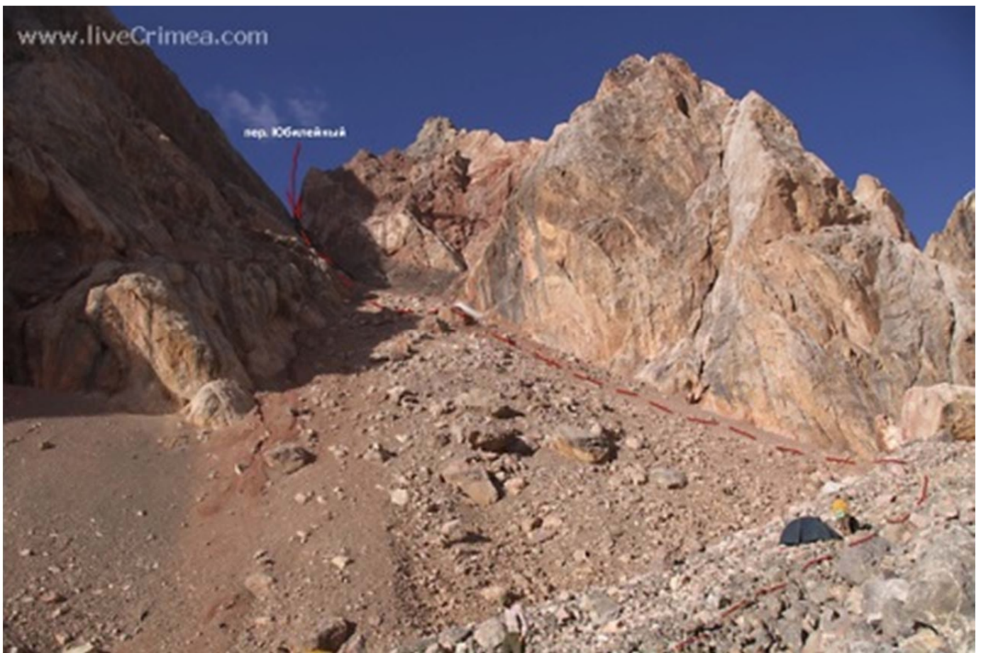
Vaade läänest, V-Zindoni orust