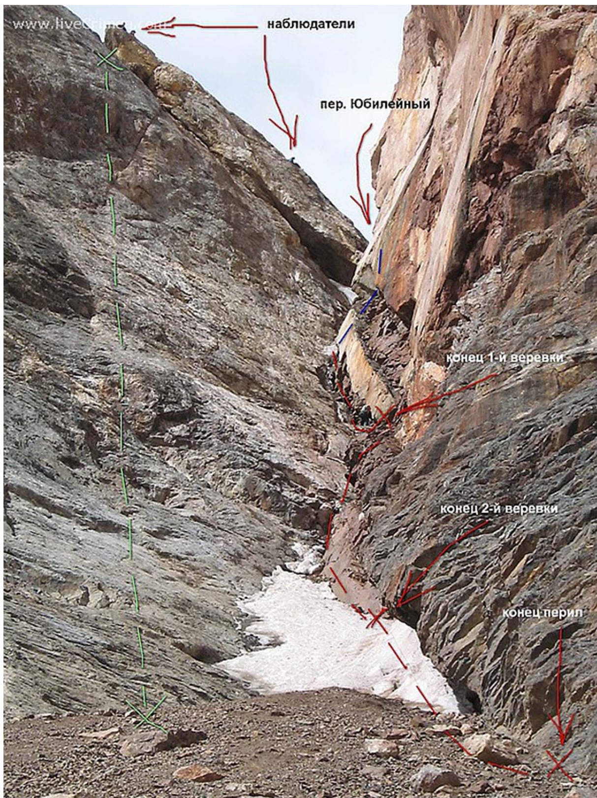
Läänenõlv on kitsas kivine kuluuar