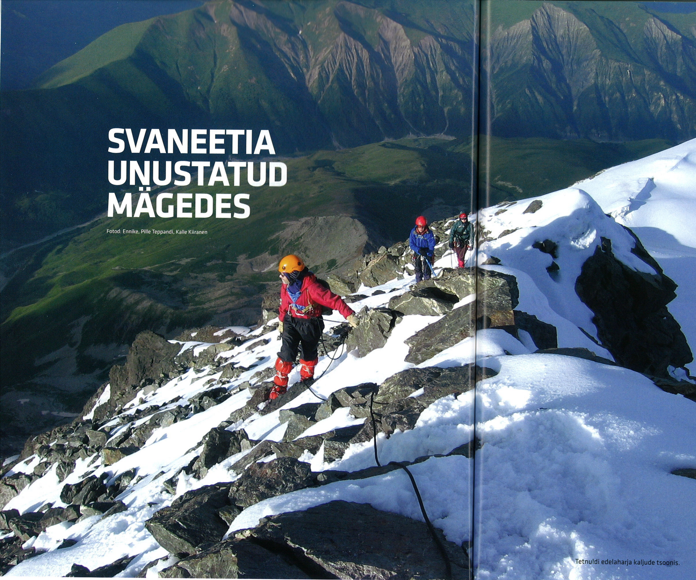
Tetnuldi edelajarja kaljude tsoonis.