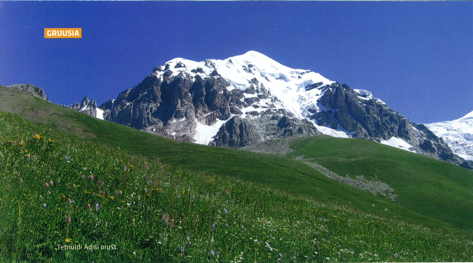
Tetnuldi Adiši orust

alustasime matka. Ilmad olid olnud varem ja olid ka meie matka esimesel kümnel päeval vihmased – sadama hakkas tavaliselt just pärast lõunat. Eks me siis kohandasime oma liikumist ilma järgi. Tõusime juba pimedas kella 4 ajal ja astuma hakkasime kella 6 paiku. Sellegi pooldest saime paar korda läbimärjaks. Ja mitte ainult ülalt sadavast vihmast – siinsetel nõlvadel kasvab väga kõrge rohi ja see oli märg ka hommikul.