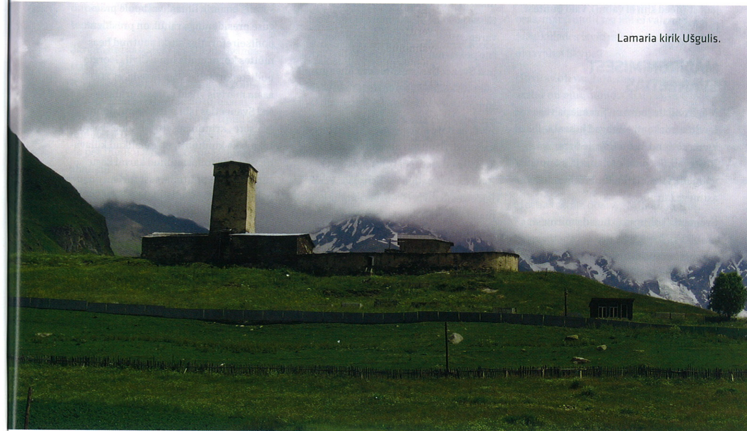
Lamaria kirik Ušgulis.

Mestia (varem – Seti), kust tavaliselt saavad alguse paljude matkajate rännakud, koosneb tegelikult mitmest külast ja 2002. aasta andmetel oli seal 2600 elanikku. Nii seal kui mujal asulates tasub kindlasti võtta koduõõbimine. See on odavam kui hotellides ja nii näeb kohalikkude elu lähemalt.