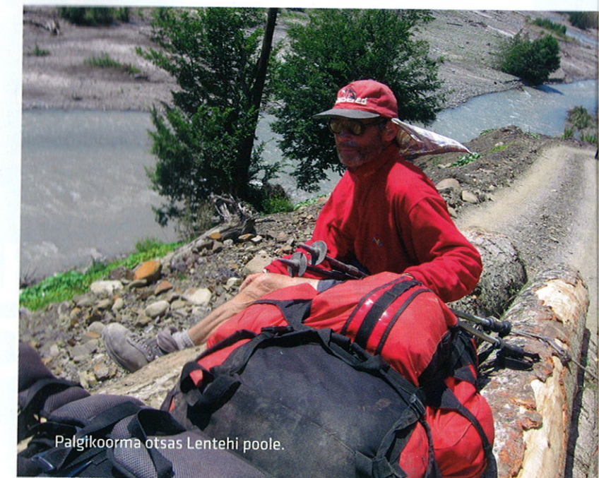
Palgikoorma otsas Lentehi poole.

Hoidsime trossidest kinni ja pärast lõunat olime Lentehis. Juhusliku mikrobussiga saime juba õhtuks alla Kutaisi. Viimane oli kunagi müütilise Kuldvillakumaa ( Colchise ) ja hilisema Gruusia kuningriigi pealinn. Praegu on see aga Imereetia regiooni keskus ja tema ümbrus on täis uhket ajalugu – Sataplia mägi ja koopad, Gelati ja Motsameta kloostrid jne. Kuid see kõik oleks juba teine jutt ja vääraks omaette kirjutükki. ■