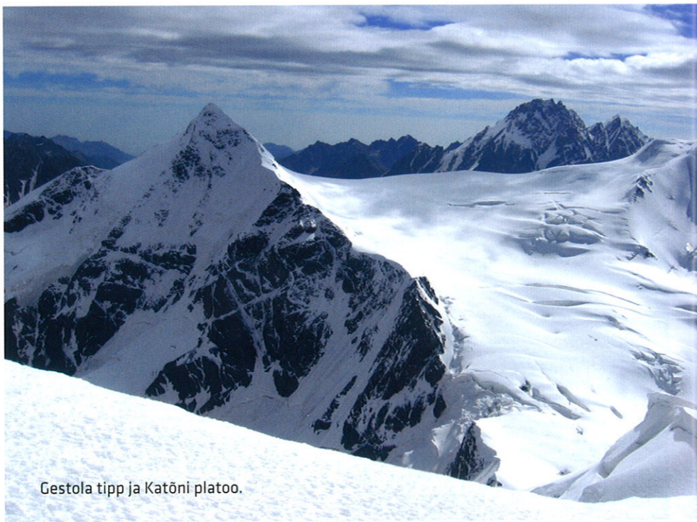
Gestola tipp ja Katõni platoo.

Tollal käisid eesti alpinistid ja matkajad tihti sealkandis. Samal 1982. aastal toimus Kaukasuses mägituriaad Baksan-