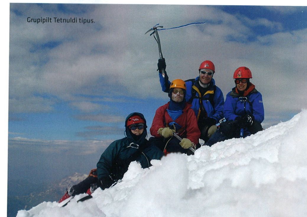
Grupipilt Tetnuldi tipus.

Kohtasime seal ka ühte hispaania gruppi – nendelgi oli plaanis tõusta Tetnuldile. Paraku olid nad selleks liiga vähe aega varunud – hispaanlased jõudsid uduse ilmaga umbes poolele maale ning pidid lahkuma. Meie aga tõusime nende jälgi mööda edasi 4200 meetri kõrgusele lumisele õlale ja püstitasime sinna tuuletaskusse oma viimase laagri.