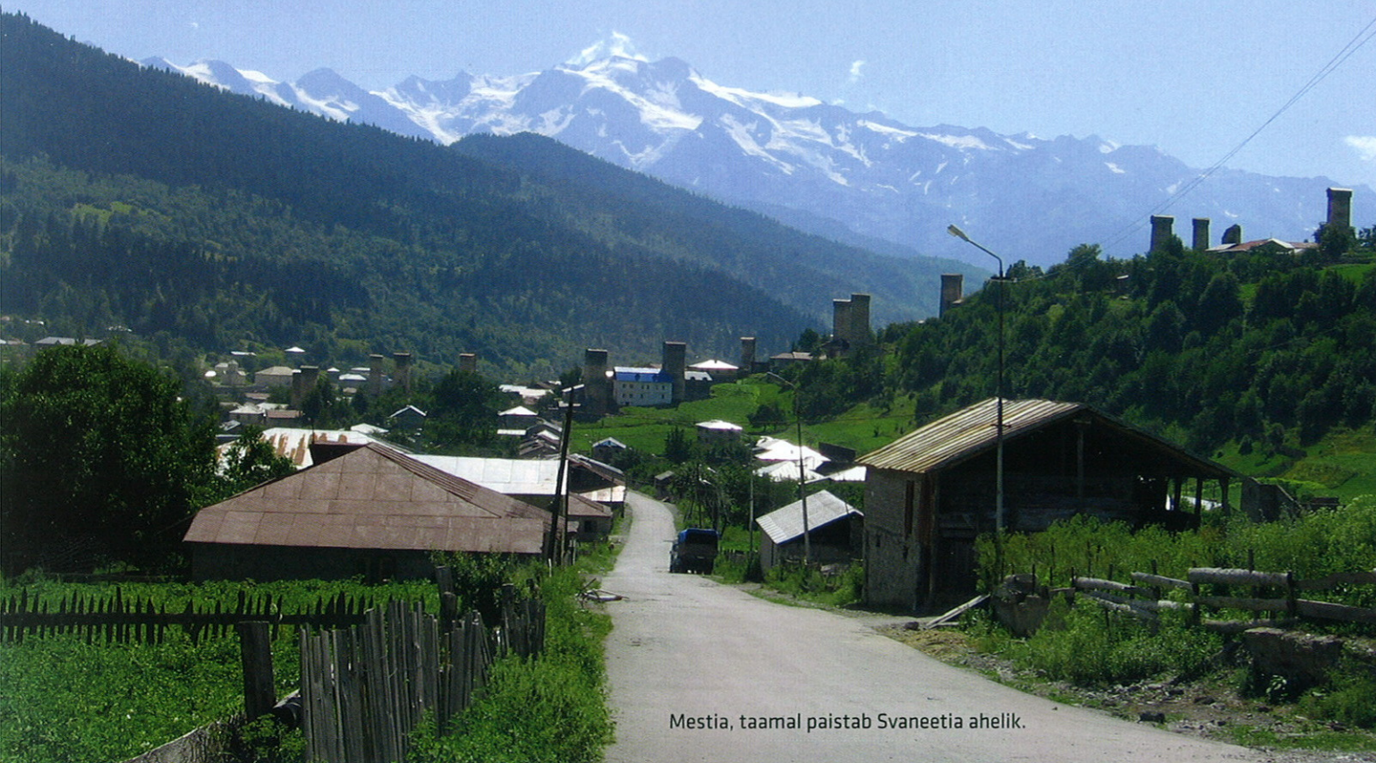
Mestia, taamal paistab Svaneetia ahelik.

nagu Eestigi Vene tsaarivõimu alt, kuid tollal püsis ta iseseisva riigina vaid paar aastat ning oli siis 1991. aastani jällegi Nõukogude Liidu koosseisus. Näiteks Mestias on kõrvuti nii kuninganna Tamara tänav kui Stalini tänav.