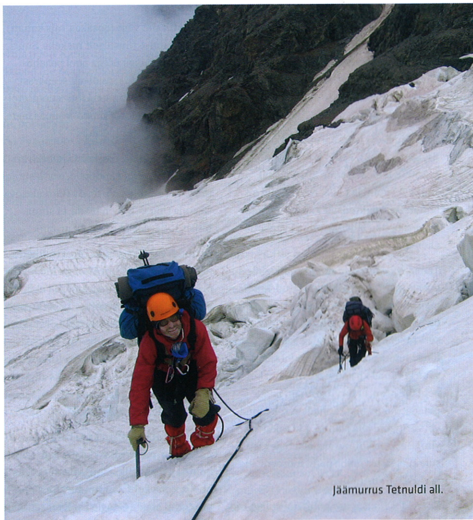
Jäämurrus Tetnuldi all.

Esimesel, 3620 meetri kõrgusel Podaroki-nimelisel kurul leidsime ukrainlaste tuurikirja aastast 1988! See näitab, et sportlikke matku pole siin ilmselt üle 20 aasta tehtud. Kohtasime kogu matka vältel ülevalpool vaid ühte gruppi! Teisel pool kuru asuv Halde liustik aga üllatas oma võimsusega – ei see veel niipea sula! Jääb ju selle ülemjooksule peaaheliku kõige võimsam osa, mis põhja pool on tuntud Bezengi seinana. Puhkepäeva ja riiete kuivatamise tegime Adiši orus, kust avanesid väga uhked vaated maailma ühele kõrgemale jäämurrule. Tetnuldi edelaharja alla liikumiseks pidime veel ületama tehniliselt lihtsa, kuid kiviohtliku Kenti kuru. Oli ka meil seal üks ärev hetk, kus tuli ülalt veereva-