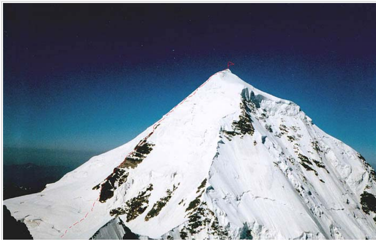
в. Тетнульд. Вид с Катынского плато

132. Тетнульд по Юго-западному гребню, 2Б к/тр (Д. Фрешфильд, М. Девуассу, И. Десаю, М. Деши, 1887 г., м. 139).