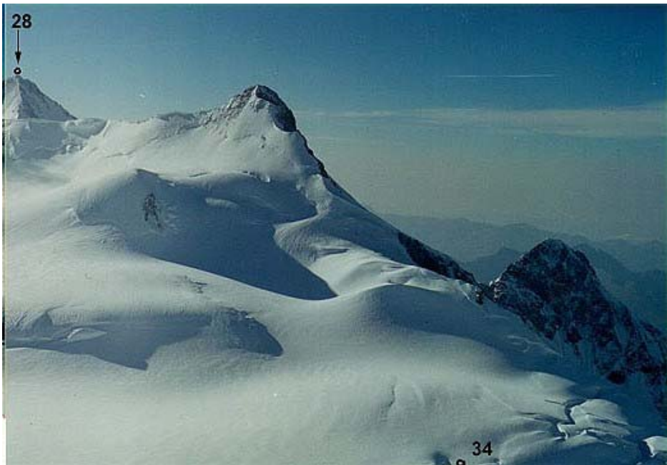
Katõni tipp Gestola tipust, paremal allpool - Lakutsa ? Taga nr. 28 - Dzangitau läänetipp (5030).